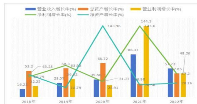
图4 展能力指标分析图