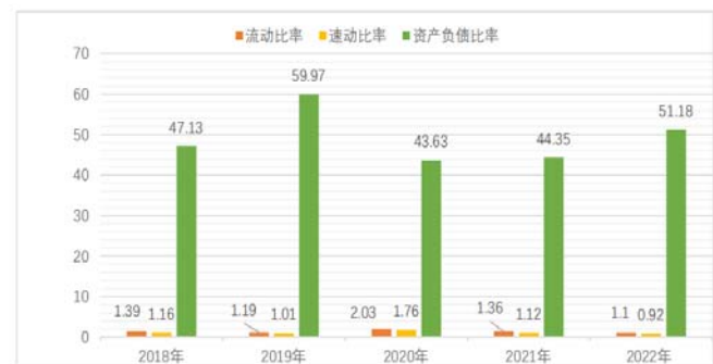
图2 偿债能力指标分析图

流动比率： 流动比率衡量的是公司支付短期债务的能力。2018年的流动比率为1.39，意味着公司的流动资产超过流动负债39%，这是一个健康的水平。2019年流动比率下降到1.19，表明短期偿债能力有所减弱。2020年流动比率上升到2.03，然而在2021年和2022年，流动比率分别下降到1.36和1.1，2021年以来，双碳政策影响下，市场供不应求，EJ股份生产线建设投入资金及经营所需资金增加，货币资金减少，同时流动负债大幅增加，导致流动性指标均较2020年下降，资产流动性有所弱化。2022年以来，公司短期银行借款大幅增加，流动负债相应增加，导致流动性指标较2021年下降。此外考虑存在一定受限资产，实际流动性弱于指标所显示。